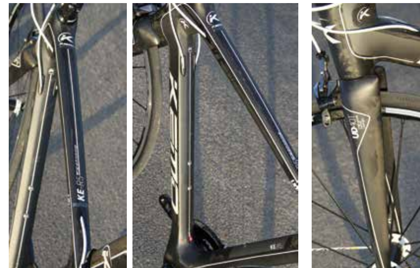
Tube horizontal de section travaillée avec une forme à multiples faces, s'affinant vers l'arrière. Tube diagonal triangulaire.